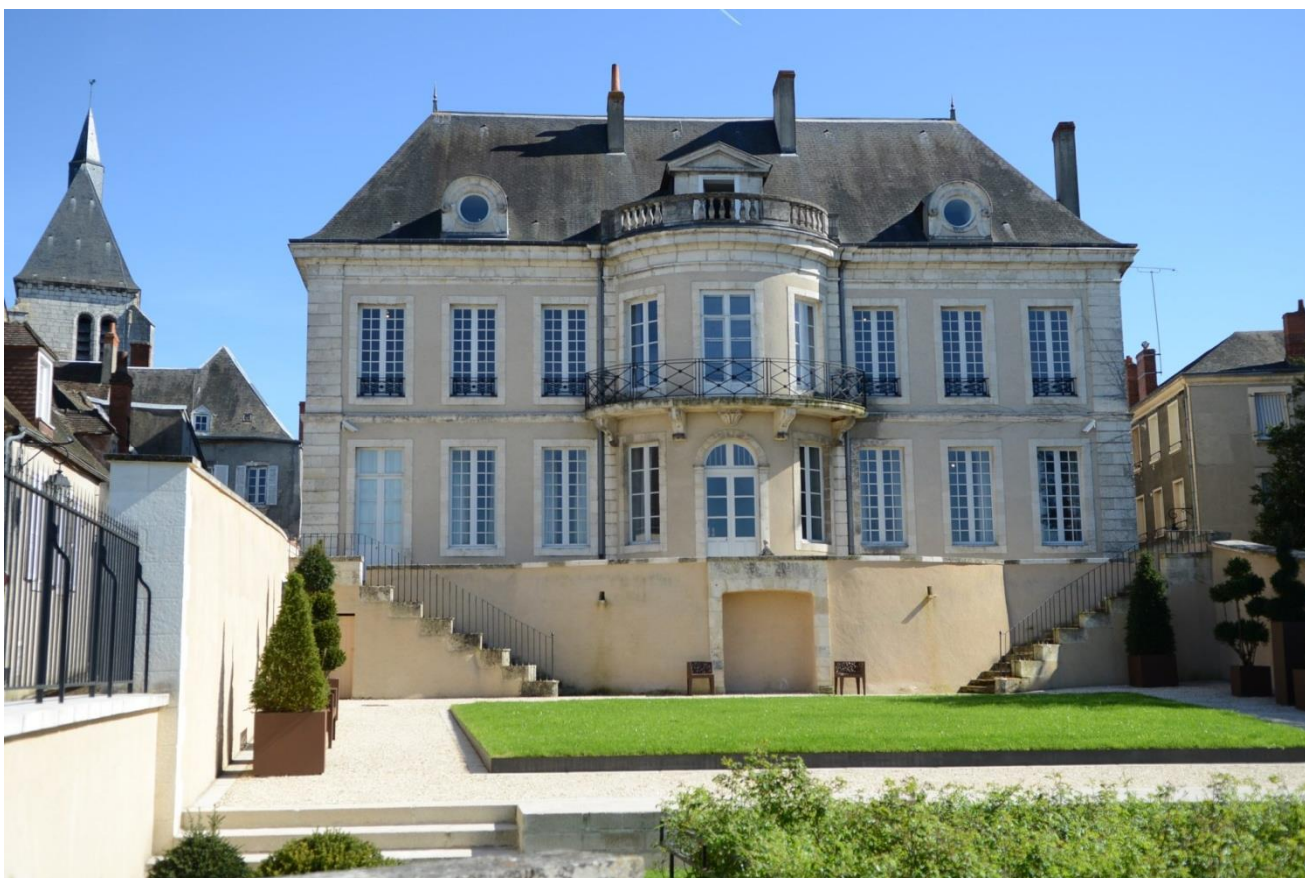
LE MUSÉE BERTRAND